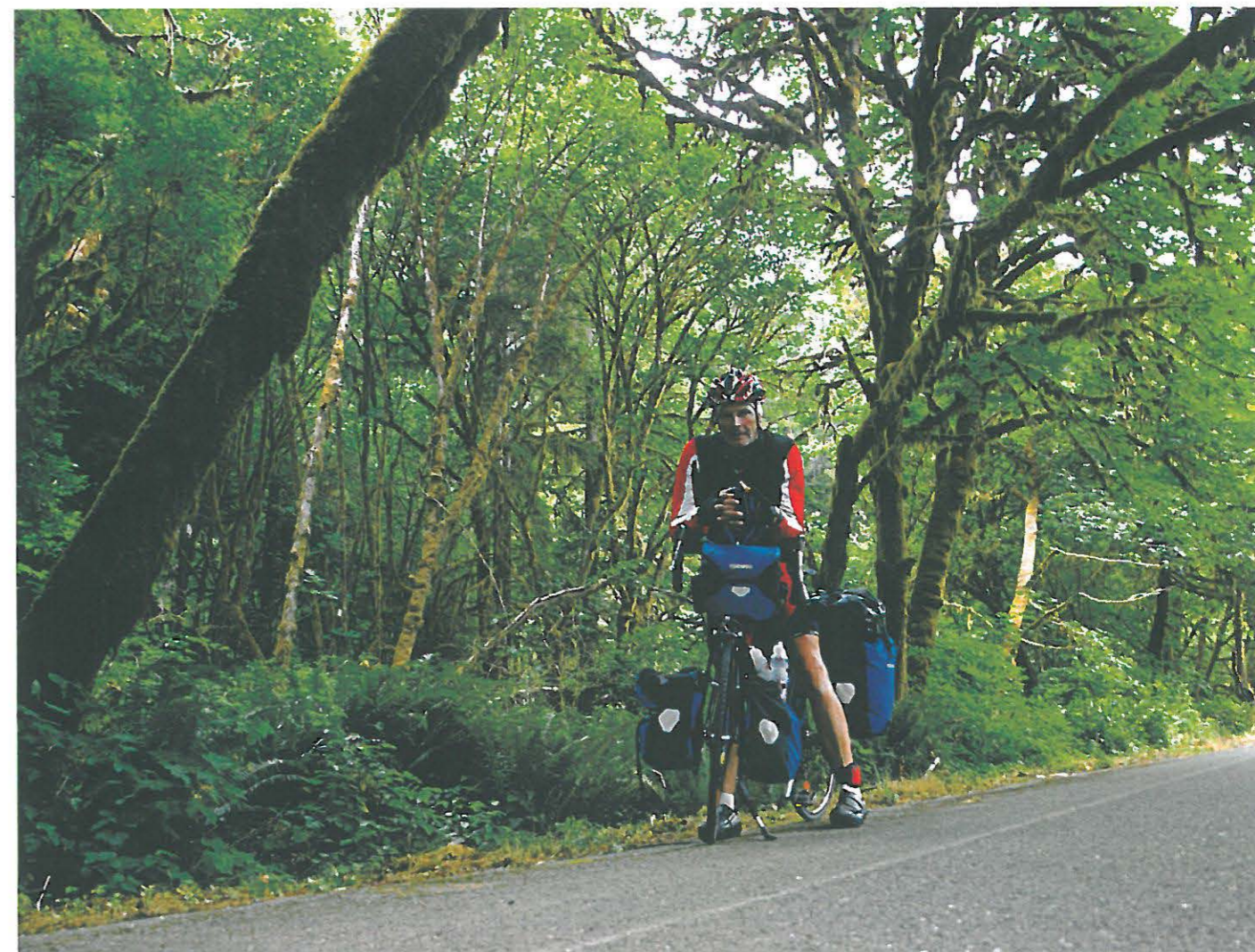
Uralt, dicht und ehrfürchtgebend: Redwoods-Nationalpark, nördlich von Eureka, Kalifornien

Ab Fort Pragg benötigt man stramme Beine, denn die sehr windanfällige Straße führt über immer höhere Übergänge. Der Ruf eines echten „Killer Hills“ eilt dem Anstieg nach Legget voraus. Wer ihn noch vor sich hat, bekreuzigt sich dreimal und senkt ehrfürchtig das Haupt. Tatsächlich erweist sich der knapp sechs Kilometer lange Anstieg mit etwa zehnpromentiger Steigung jedoch als eher harmlos – jedenfalls