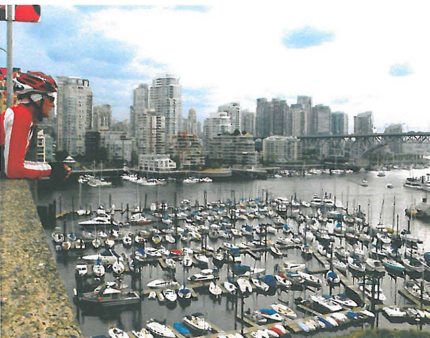
Am Ziel: English Bay, Vancouver, Kanada