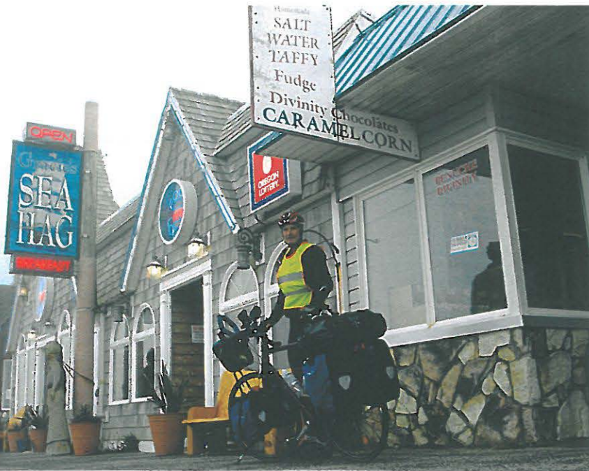
Nebel und Nieselregen am Morgen: Dunes City, Oregon

Genau wie San Francisco ist Vancouver an drei Seiten von Wasser umgeben. Aber seine Einwohner verstehen unter Freiheit eher die nordische Variante: die Erkundung der umliegenden „Outdoors“ beim Wandern oder mit dem Rad. Ich ziehe, hier am Ende meiner Reise, die San-Francisco-Variante mit Capuccino im Straßencafé vor.