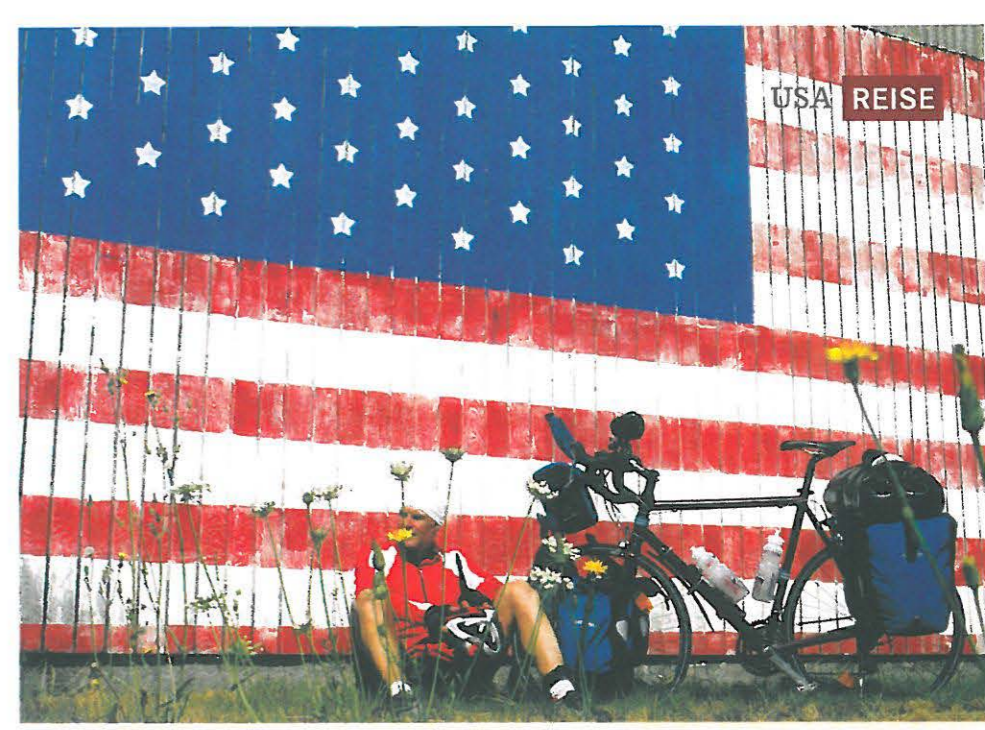
Stars & Stripes allgegenwärtig: Pause in Crescent City, Kalifornien

Die Brücke zwischen dem radfreundlichen Oregon und dem mit etwas rauherem Charme gesegneten Washington wird in Astoria geschlagen. Ein fast sechs Kilometer langes Straßenbauwerk