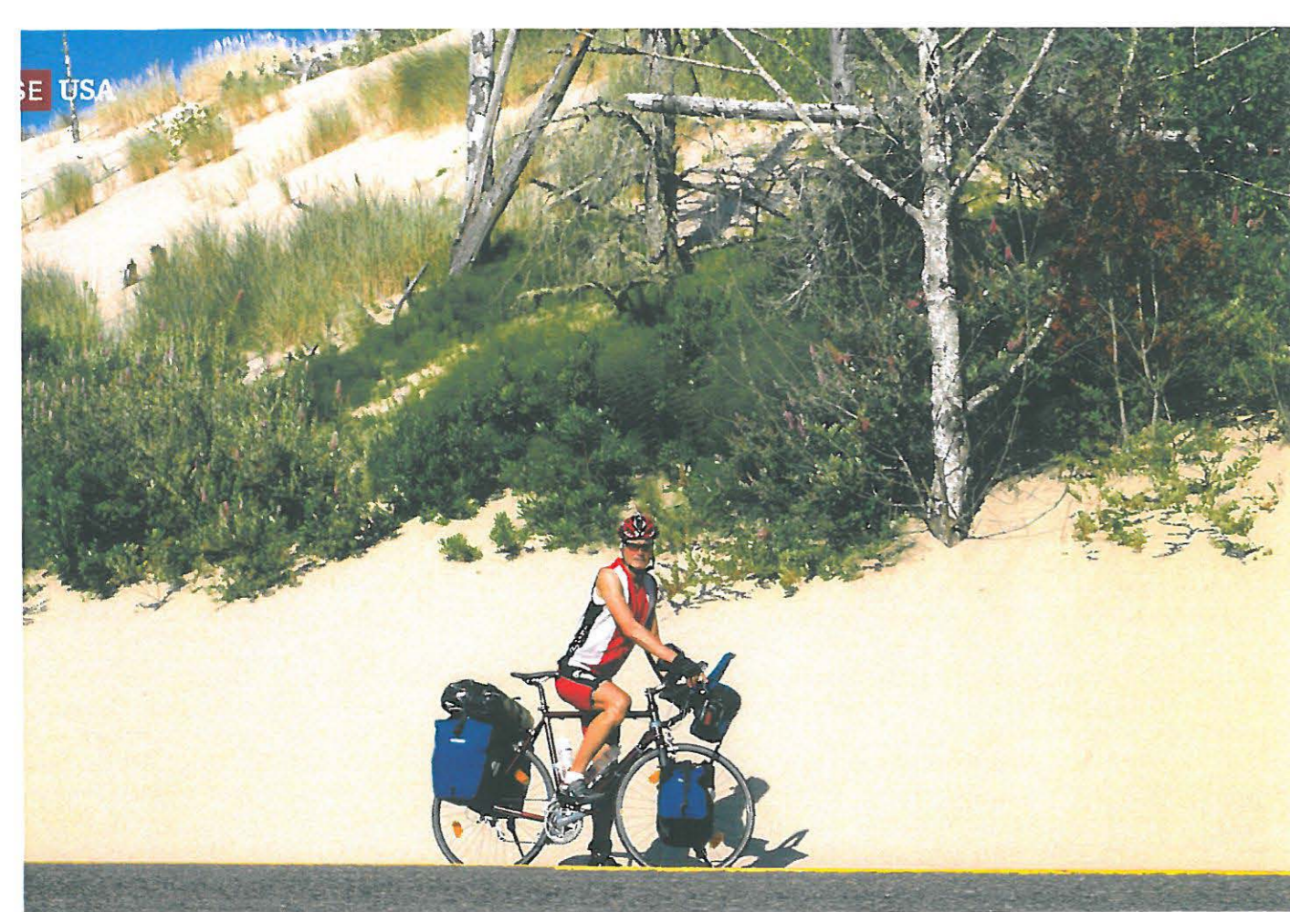
Highway und Dünen: Zwischen Bandon und Florence, Oregon (o.) - Start um 6 Uhr morgens: Sonnenaufgang in Tomales Bay, Kalifornien (Mi. li.) - Waschsalon in Astoria, Oregon (Mi. re.) - Warten auf die Fähre: Port Townsend in Washington (u.li.) - Morgendliche Begrüßung vor dem Zelt: Elch in Birch Bay State Park, Washington (u.re.)