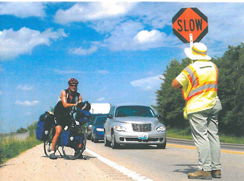
Gilt auch für Radreisende: SLOW in der Kolonne