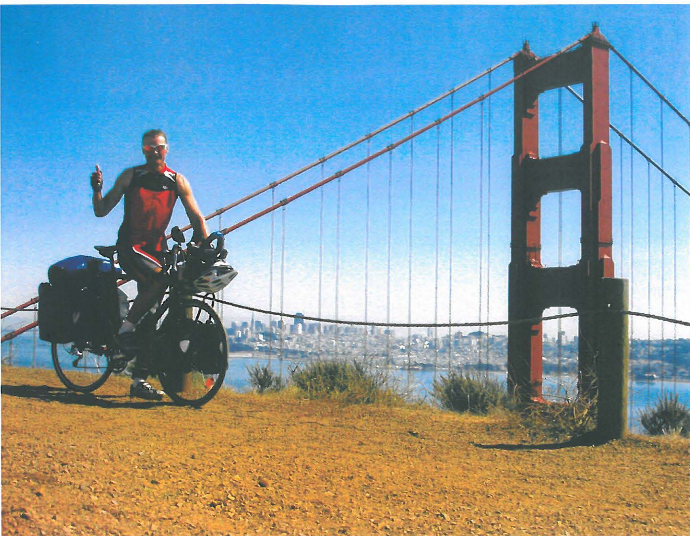
Mit dem Fahrrad über die „Rote Brücke“: Golden Gate Bridge (Nordseite), San Francisco, Kalifornien