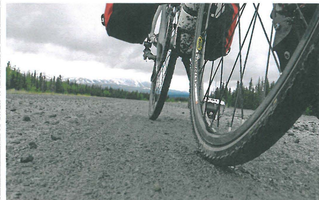
Dirty Road Dalton HGWY

blüffend, witzig wie dramatisch – und dabei immer voller erhellender Informationen. Das Buch enthält auch viele Farbfotos von diversen Stationen seiner Reise.