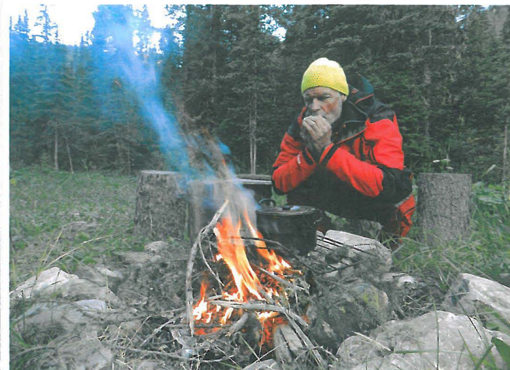
Campen in Alaska