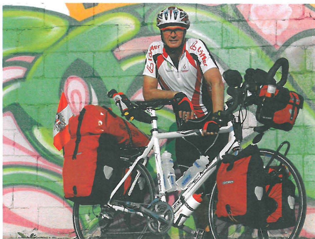
Start der Alaska Reise in Fairbanks